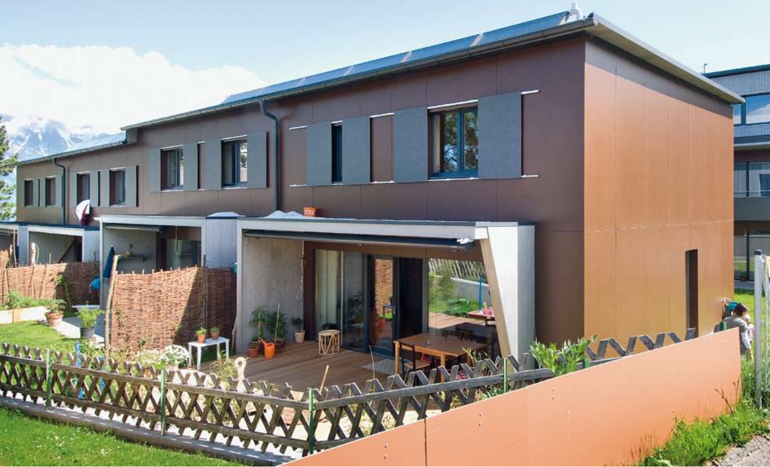
▲ Zwei Oberflächen gestalten die Fassaden der Gebäude: Dunkelbraune Melaminharzplatten wechseln sich ab mit silbergrauen Fichtenholzbretter