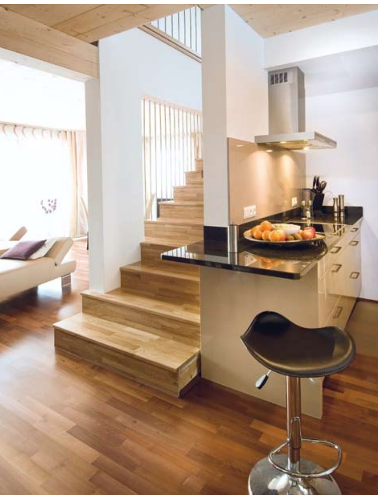
▼ Beliebt: Alle Wohnungen waren bereits in der Bauphase verkauft