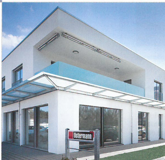
Der neue Ostermann-Standort in der Schweiz.