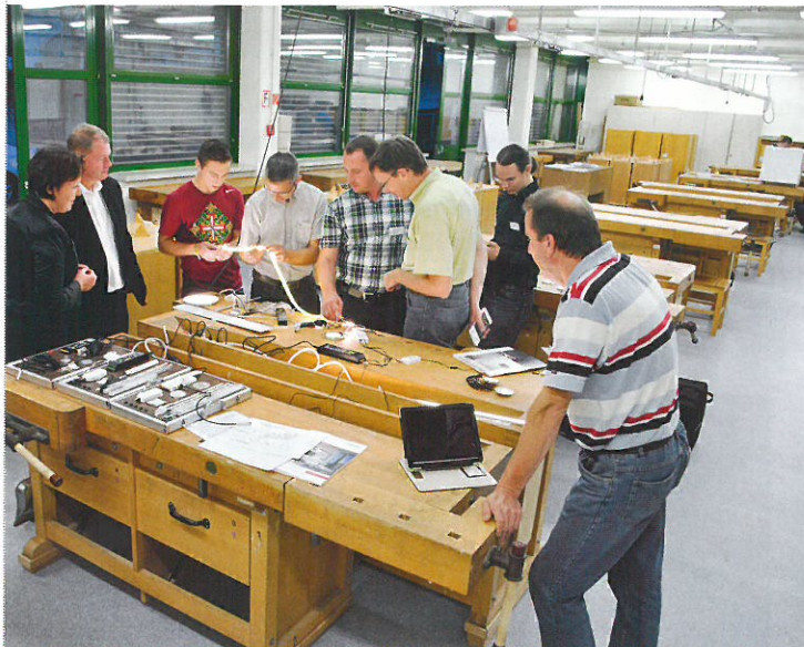
2014 machte die Workshopreihe auch in der Grazer Ortweinschule Station.

Am 8. April 2015 hat Würth in St. Johann im Pongau ein weiteres Kundenzentrum in Salzburg eröffnet. Für den Spezialisten im Handel mit Montage- und Befestigungsmaterial sind dabei die gute Lage und eine Anzahl an Gewerbetreibenden in der Region attraktiv. Auf einer Verkaufsfläche von 430 m 2 sind mehr als 4.000 Artikel für Handwerker und Gewerbetreibende verfügbar, zudem kann jederzeit auf das 100.000 Artikel umfassende Sortiment zugegriffen werden. In den insgesamt 39 Kundenzentren konnte Würth 2014 einen Rekordumsatz von 28,8 Mio. Euro erzielen, der Gesamtumsatz des Unternehmens 2014 betrug 169,0 Mio. Euro. www.wuerth.at ■