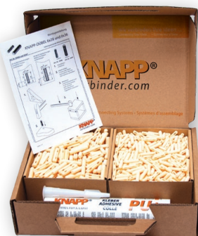
Tourillons KNAPP® Box

Les colles KNAPP® sont également disponibles dans les coffrets découvertes suivants :