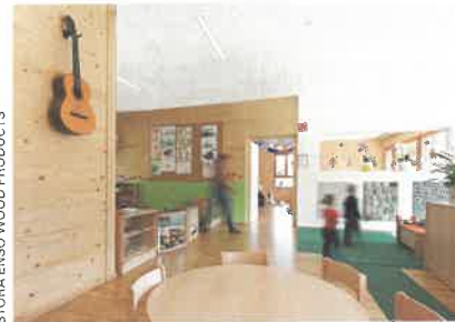
STORA ENSO WOOD PRODUCTS

Knapp 70 Schulen und Kindergärten hat Stora Enso allein in Österreich bereits mit ihren modernen Lösungen auf Massivholzbasis beliefert. Neueste