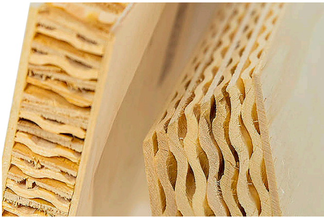
„aerowood“-Leichtbauplatte des Sperrholzwerts Schweitzer gewann einen Interzum Award

Matthias Pollmann, Geschäftsbereichsleiter Messemanagement der Koelnmesse, und Red Dot-Geschäftsführer Vito Orazem überreichten den Preisträgern die Auszeichnung „Hohe Produktqualität“ und erstmals die neu eingeführte Kategorie „Tiny Spaces“, welche das Wohnen auf kleinem Raum beschreibt. Zu den Gewinnern des „Best of the Best“-Awards zählt das österreichische Sperrholzwerk Schweitzer – zum einen mit seiner „aerowood“-Leichtbauplatte und zum anderen der „Retro-Flex“, einer Federleiste als Matratzenunterfederung.