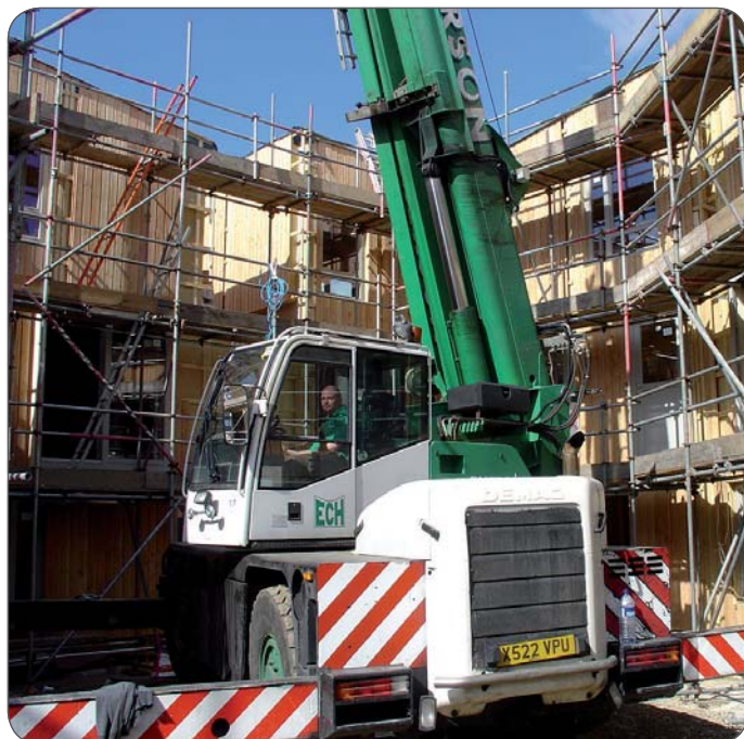
Die Wände wurden nach ihrer Ankunft aus Deutschland in ihre Position gehoben und sofort montiert.