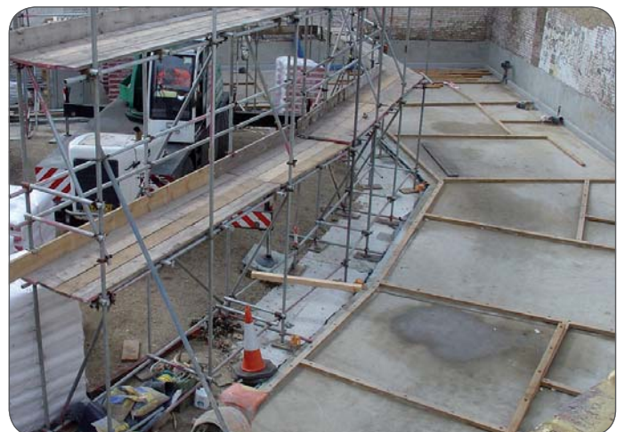
Bevor es mit der Montage losging, wurden Richthölzer auf die Bodenplatte verlegt.