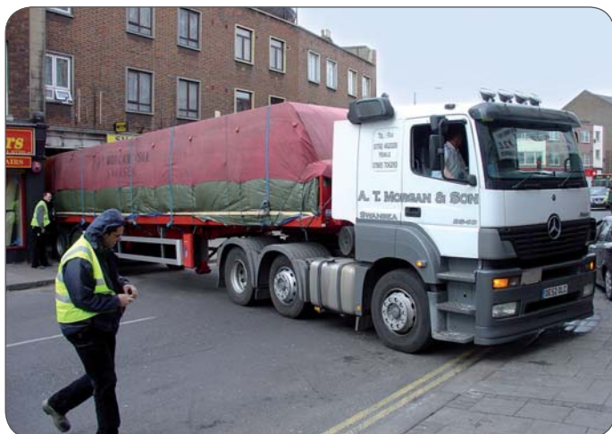
Spannend: Drei Stunden brauchte der Fahrer durch die schmale Einfahrt, denn auf beiden Seiten standen ihm nur 45 mm „Luft“ zur Verfügung.

„Grüne Wiese“, sondern für innerstädtische „Nischen“: für brachliegende Grundstücke in Hinterhöfen und anderswo. Die zu finden ist gar nicht einfach. Aber es gibt sie. Oft traut sich nur niemand so richtig an sie heran. Eine dieser Nischen fand SUSD in Harlesden im Nordwesten Londons, einem Stadtteil mit „hohem sozialem Konfliktpotenzial“. 2001 hatte er die höchste Mordrate Englands. Das Büro erwarb 2005 den 120 Jahre alten Bestand