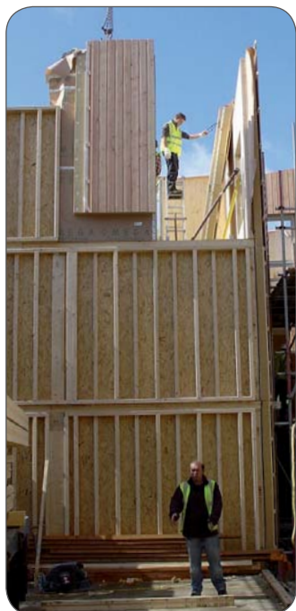
Die Montage musste auf engstem Raum erfolgen.

Holzrahmenbau-Wände stellen einen optischen Kontrast dar. Das englische Baurecht fordert eine Brandschutzbeschichtung für Holzoberflächen ohne Bekleidung, doch ein üblicher Anstrich hätte das Holz darunter zugedeckt. Um dies zu vermeiden, stellten die Planer von SUSD beim zuständigen „Building Control“ einen Antrag für eine alternative Lösung. Nach genauer Prüfung aller Details erlaubte das Amt schließlich doch,