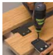
Verschrauben mit Dielen