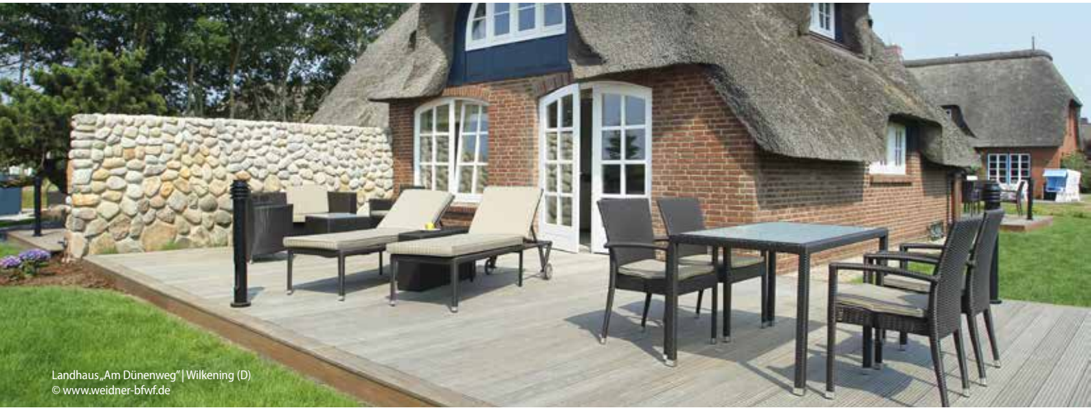
Landhaus „Am Dünenweg“ | Wilkening (D)