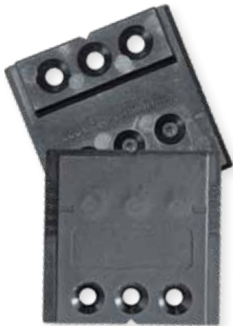
Quatro 65/25 Artikel Nr. Ko81