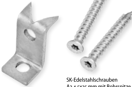
SK-Edelstahlschrauben A2 4,5x35 mm mit Bohrspitze