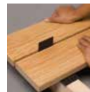
QUATRO 65 als Abstandhalter