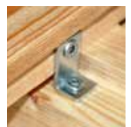
Z-DECK fertig montiert