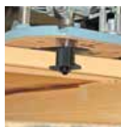
Fräsen mit Oberfräse (optional)