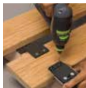
Vorbohren mit Schablone