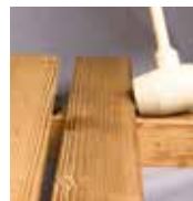
Nächste Diele ansetzen