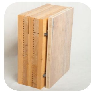
Fertig montiert, jederzeit aushängen möglich