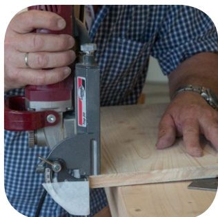
Fräsen des Werkstückes mit Lamellomaschine (Tiefeneinstellung 10 mm)