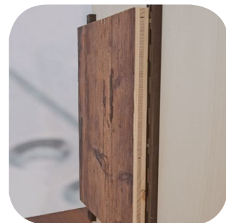
Einhängen des Werkteils an Schiene