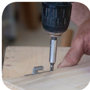
Einsetzen und Verschrauben oder Verkleben