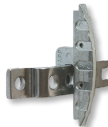
KOMBI Haltebügel horizontal