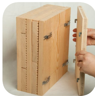
Werkteile einfach einhängen