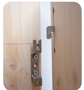
KOMBI Hakenlamelle mit vertikal montierten Haltebügel.