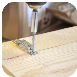
KOMBI Haltebügel am Werkstück festschrauben